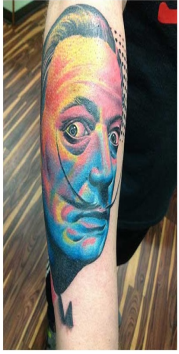
1) Salvador Dalí