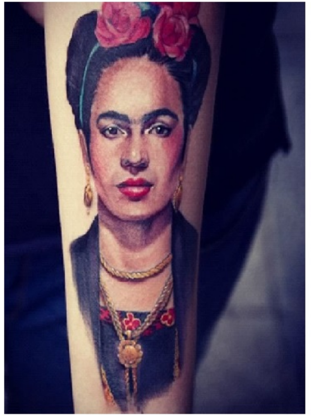
11) y 12) Versiones de Frida Kahlo

Leonardo da Vinci fue un pintor, arquitecto, escultor y filósofo.