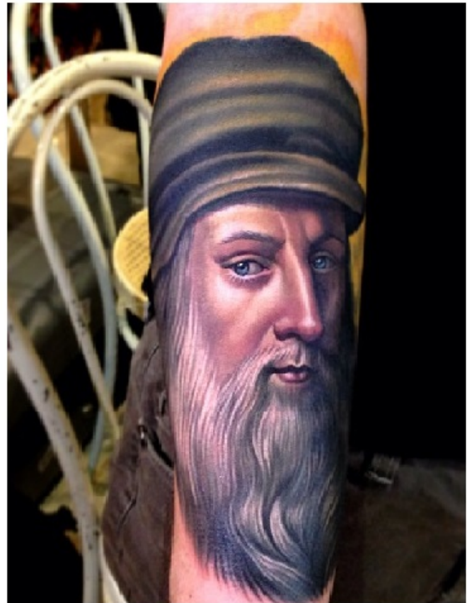
13) Hombre de Vitruvio por Da Vinci 14) Leonardo da Vinci

si te gustan los tatuajes y eres amante de la pintura... ya sabes en que podrías inspirarte!!!