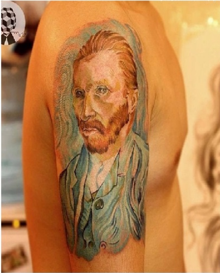
3) Vicent van Gogh

Vincent Van Gogh fue un pintor neerlandés, principal exponente del postimpresionismo.