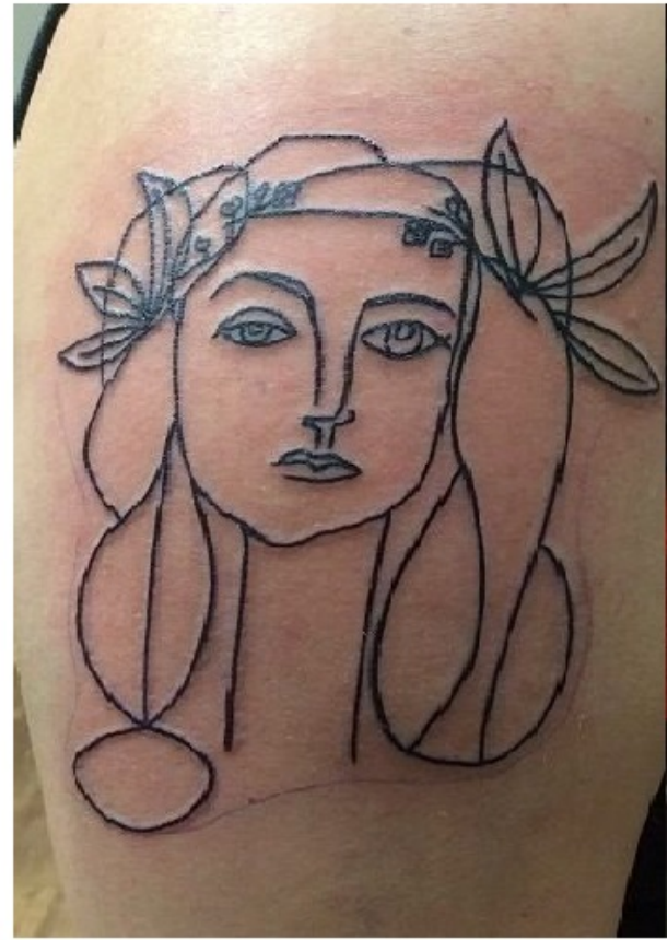
7) Paloma de la Paz y 8) Guerra y Paz por Pablo Picasso

Edvard Munch fue un pintor noruego con una mirada expresionista.