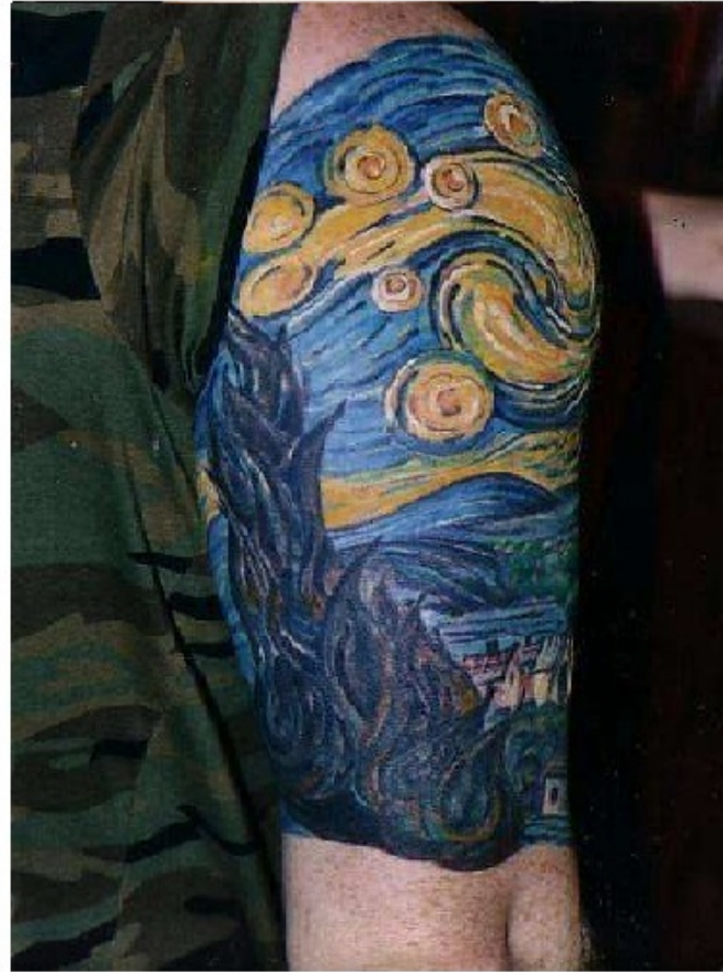
4) La noche estrellada por Van Gogh

René Magritte fue un pintor surrealista belga, conocido por su juego de imágenes ambiguas.