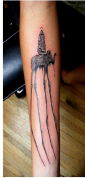
2) Elephants por Dalí