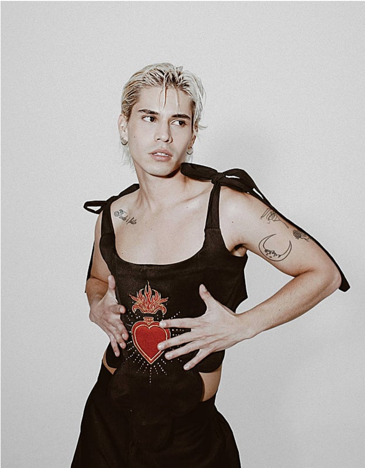
Corsé del diseñador español Alberto Batres. 150€