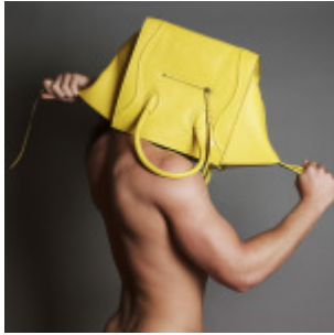
Valentín Benet en sesión de fotos k4b