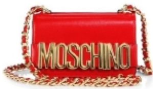
moschino red crossbody chain logo