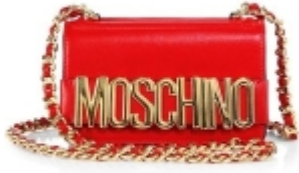
moschino red crossbody chain logo