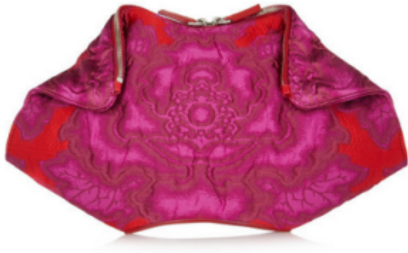
ALEXANDER MC QUEEN