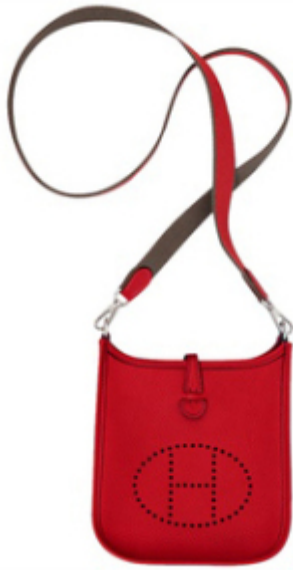
mini evelyne HERMES