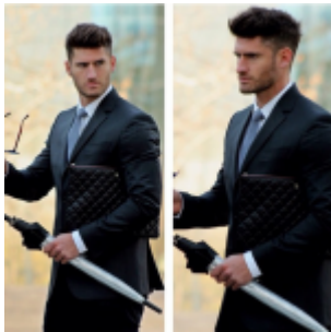
Valentín usanso CHANEL XL Leather Black Quilted Zip-Pouch Clutch

Sin duda que son muchos los personajes famosos e íconos de la moda que han pasado por Kill For a Bag. Ya sabes dónde encontrarlos y cuáles son los mejores precios, ahora sólo debes atreverte a utilizar una gran prenda que puede darle un toque a cualquier tenida !