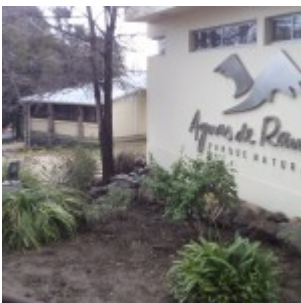
Entrada Parque Aguas de Ramón.