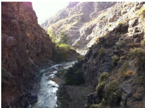
Parque Natural Puente Ñilhue