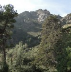
Parque San Carlos de Apoquindo.