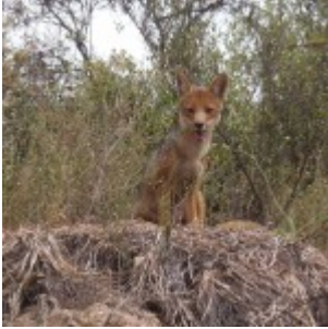
Zorro Culpeo, Fauna Parques Cordiller.