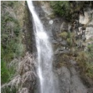
Parque Aguas de Ramón.