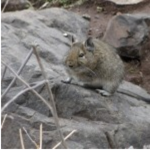
Fauna Parques.