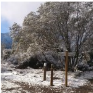
Parque San Carlos De Apoquindo, nevado.