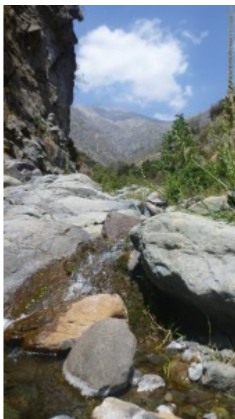
Parque Quebrada de Macul

Dirección: Álvaro Casanova 130, comuna de Peñalolen.