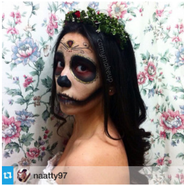
Maquillaje Halloween por Tartaletita Bazar

SANTIAGO.- Cuando comienzan los días de calor no dejo de pensar en que se viene Navidad, Año nuevo, matrimonios, graduaciones, entre otros eventos. Y aquí, me empiezo a estresar. Tengo que empezar a pedir hora en la peluquería que jobvio no tiene horas hasta mil años más! , y pienso: mejor debería pintarme las uñas sola; quizás sólo me alise el pelo; etc. Todo lo que sea posible para verme bien y sin tener que esperar o pagar de más. Por eso les cuento que ¡ya no más! Olvídense de encontrar hora en una peluquería que les queda a 1 hora de la casa, porque ahora todo es ¡a domicilio!