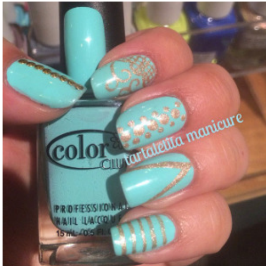
Nail Art de tartaletita

Dentro de los servicios que Tartalitita ofrece, podemos encontrar uñas acrílicas, esmaltado permanente, parafinoterapia, limpiezas faciales, tratamientos de hidratación profunda, tratamientos Anti-age y perfilado de cejas. Los precios entre los que se manejan son: