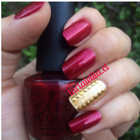
Nail art de Tartaletita bazar