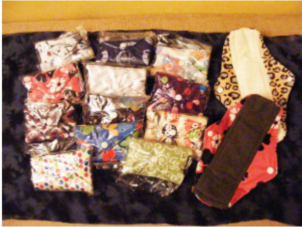
Toallas de tela, re-utilizables.

De esta manera, las amigas y socias quisieron dar a conocer estos productos y hacerlos un poco más asequibles para las estudiantes que además de costear los gastos que conlleva la etapa universitaria como son las fotocopias, pasajes, comida, entre muchas otras. “Fue así que nos propusimos importar copas menstruales para la venta y toallas de tela. Pero desde un principio, decidimos darle una acción política, que es transformar nuestro espacio de venta como una vitrina de información sobre el cuidado de nuestra sexualidad, asumiendo que como mujeres debemos hacernos cargo de nuestro género, nuestro ser, y no dejar aquello que es propio de nosotras sea controlado por ginecólogos -en el cuidado de nuestro sexo-, por obstetras -en el cuidado de nuestro parto y crianza-, y además por políticos en el control de nuestra natalidad, y por otra parte nuestros esposos o parejas en el cuidado de nuestra imagen” , comentó la vendedora.