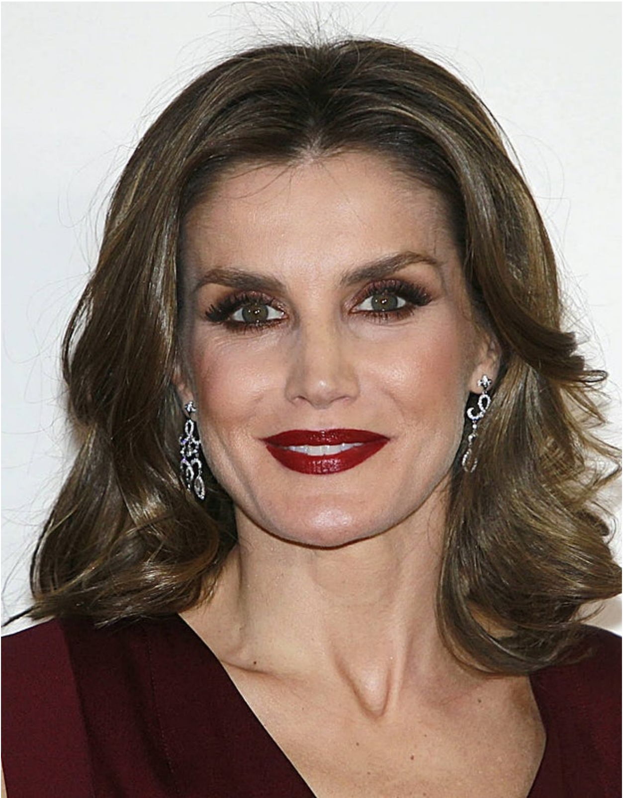
Doña Letizia luce un llamativo maquillaje en los Premios Cavia 2017.