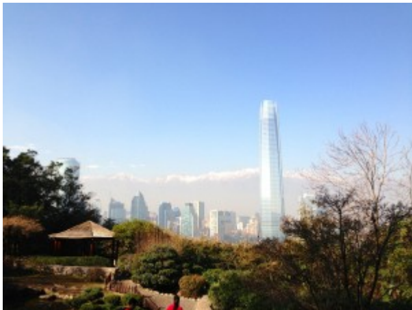
Vista Cerro San Cristóbal

Santiago es una gran ciudad... llena de grandes edificios, calles, autos, en fin, cemento por todas partes. Consumidos por el trabajo y la ocupada vida, nos olvidamos de las otras cosas que esta ciudad nos ofrece: ese conjunto de montañas que la rodea detrás de esos enormes edificios.