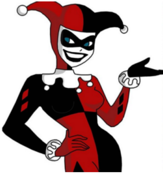
Harley Quinn estilo clásico

1.- Márcalas justo por la mitad. Utiliza una regla para dibujar otra línea de 2.5 cm hacia afuera de la línea central. En la blusa negra, dibuja la segunda línea a la izquierda del centro cuando se enfrenten. Para la blusa roja, dibuja la segunda línea a la derecha de la línea central cuando se enfrenten.