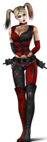
Harley Quinn estilo Arkham