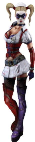
Harley Quinn Arkham Crank