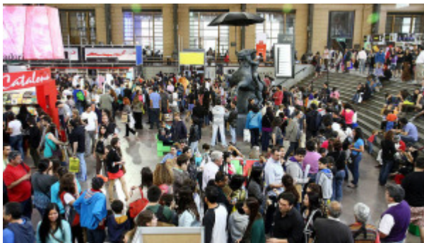
Versión N°34 de la Feria FILSA

SANTIAGO.- Con el lema “Santiago está lleno de autores”, se dio el vamos a la versión N°34 de la Feria Internacional del Libro de Santiago, la cual se inauguró el pasado 23 de octubre y estará abierta hasta el 9 de noviembre.