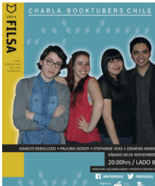
Afiche oficial de los Booktubers para Filsa 2014