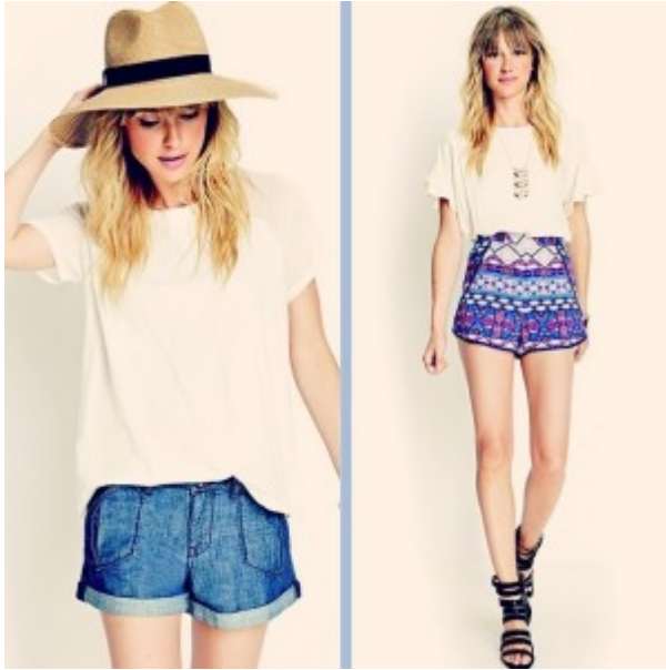
Tenida de verano Forever 21

Moda: La propuesta de moda que tiene F21, es muy poco común y tiene ropa para satisfacer el gusto de cualquier mujer, desde un simple short para el verano, hasta un lujoso vestido para algún evento.