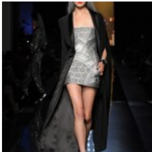
Jean Paul Gaultier Autumn/Winter 2011 show