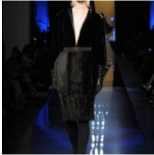
Jean Paul Gaultier Autumn/Winter 2011 show

2011 show, un año después celebridades como Kelly Osbourne y Kate Moss ya mostraban su melena plateada al mundo.