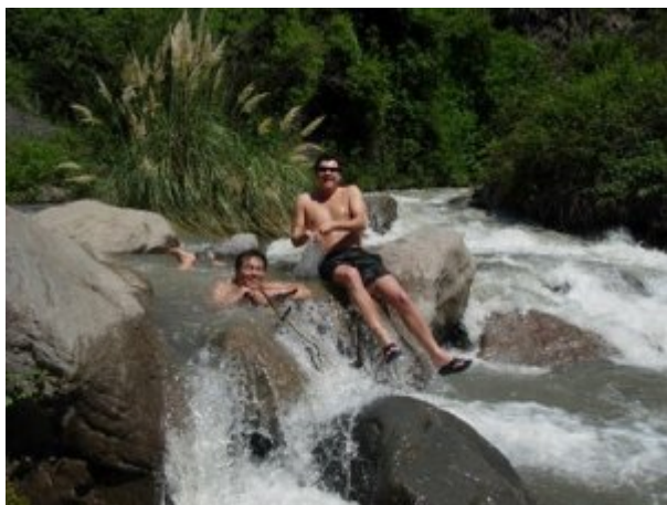
Turistas disfrutando en el Santuario

“A mi me gusta mucho el trekking, pero tengo una operación en los meniscos (rodilla), por lo que no puedo exigirme demasiado, por eso me encantó este lugar: la caminata el livianita y puedes pasarte el resto del día disfrutando del sol mientras haces un picnic y te relajas en el pasto. A mi me encantó”, comenta.