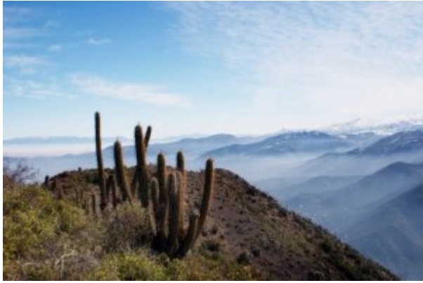
Cactus en las laderas del Pochoco

Este cerro de 1.800 metros de altura está ubicado en el sector precordillerano, a sólo 16 km de Santiago. Subirlo tarda dos horas de caminata, en las que te internas en la hermosa vegetación, y te rodeas de aves y animales silvestres. El sendero se encuentra bien delimitado y no es difícil de subir. Una vez que llegas a la cima, tendrás una vista privilegiada del Valle Arayán en todo su esplendor.