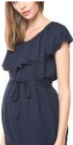
Blusa Frey Azul Mama-Licious. $ 25.990