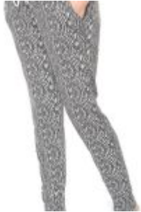
Pantalon Cammy Gris Mama-Licious. $ 29.990