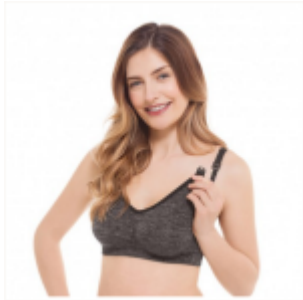
Sostén Modelo Yoga $ 37.900