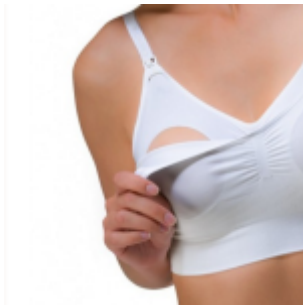
Sosten Lactancia $ 16.900