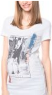
Polera Zia Blanca Mama•Licious. $ 14.990

Y si aún no encuentras nada que llene tus expectativas te invitamos a crearlo tú misma. Gracias al sitio creativaatelier.com ¡es muy sencillo! Sigue los pasos y diseña tus propios vestidos para el proceso del embarazo. Puedes jugar con colores y telas, lo importante es que siempre te veas increíble.