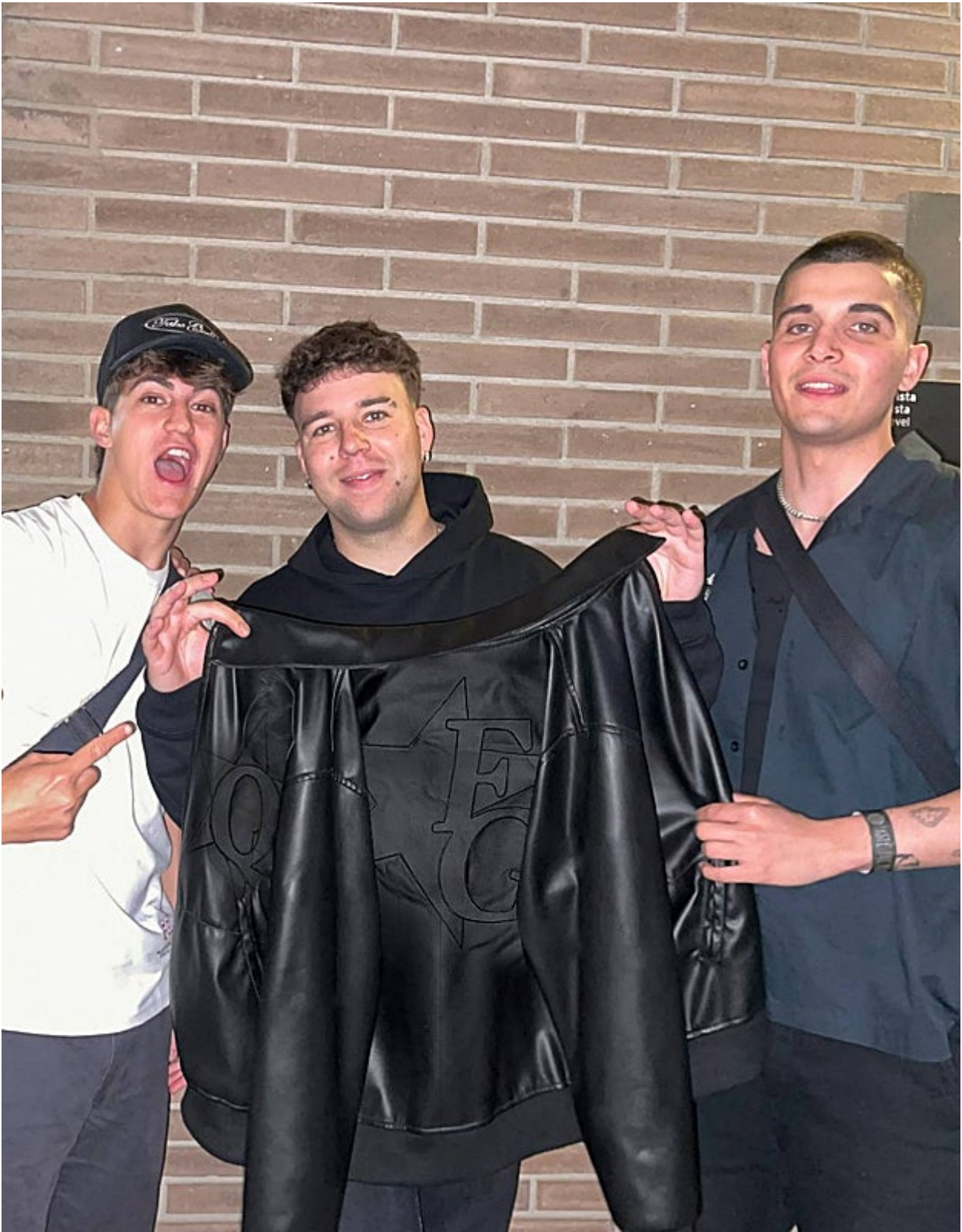
Quevedo ha iniciado una colaboración con Fake Gods.