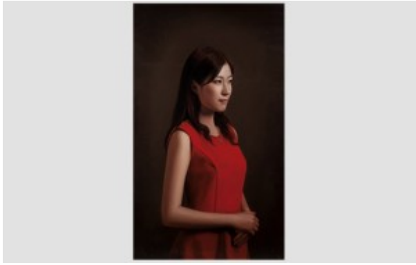
“La Juventud” del artista Zhou Song