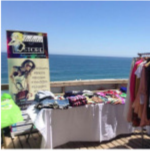
show room de Julyta Store en Reñaca

consejos para comenzar a importar y así comenzar con sus propios negocios.