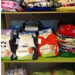
Pañales Eco Abrazos de bebé.

Eco abrazos de bebé es el nombre de la tienda y de la línea de pañales ecológicos que ofrece Lisette en su tienda ubicada en av. Italia 1805 loc 8. “La gente veía los pañales de mi bebé y me preguntaban cómo funcionaban y si eran prácticos. Así que comencé a venderlos”, agrega. Lleva dos años desde que comenzó a importar los pañales y otros productos amigables con el medioambiente.