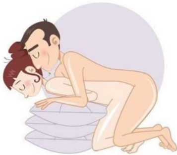
Postura sexual el esfinge

La esfinge es una de las posiciones sexuales más comunes, en donde el hombre debe montar a la mujer, la cual se encuentra apoyada sobre sus antebrazos. Muy placentera y a la misma vez muy excitante para ambas partes.