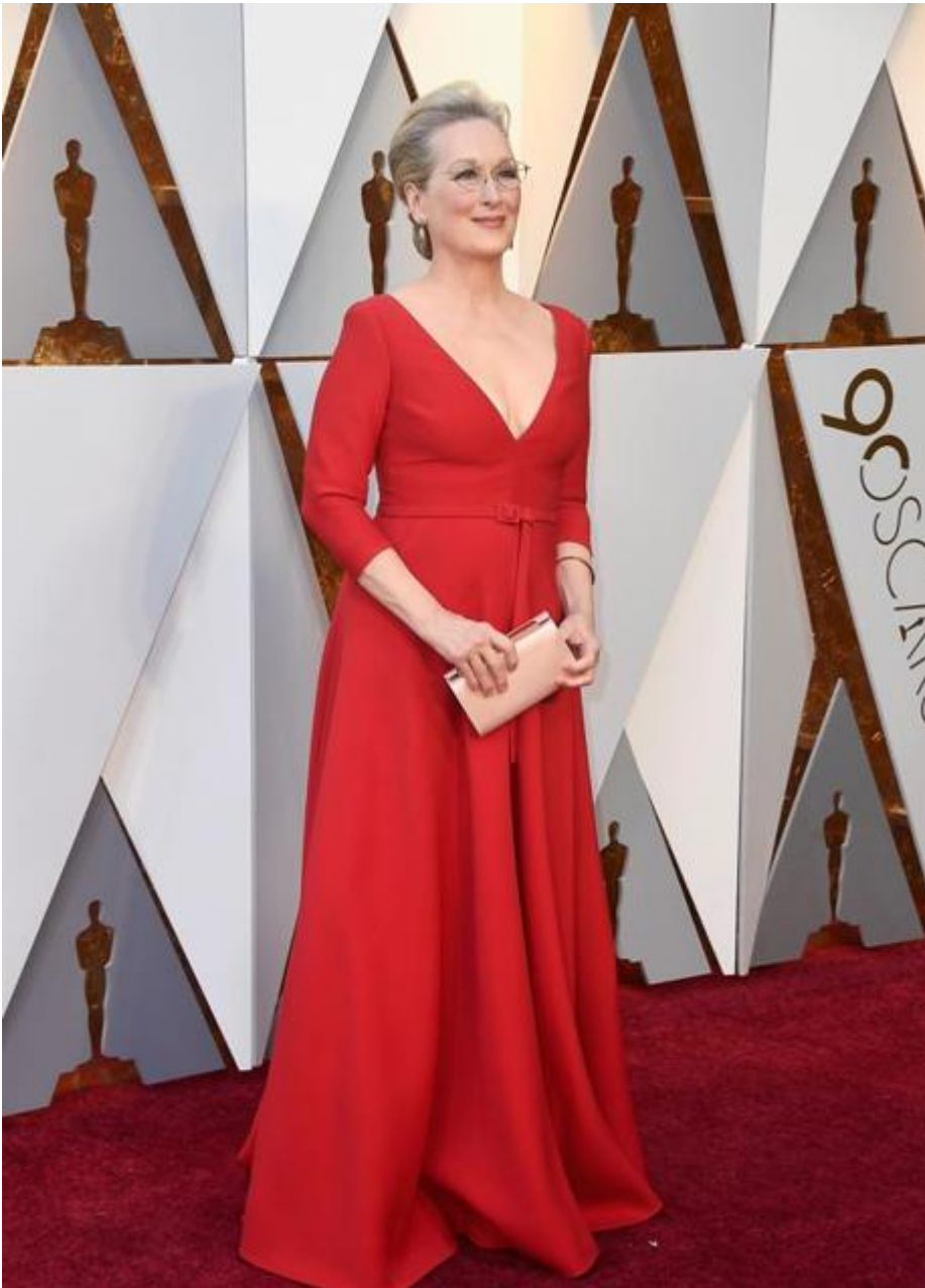
Meryl Streep en los Oscar 2018