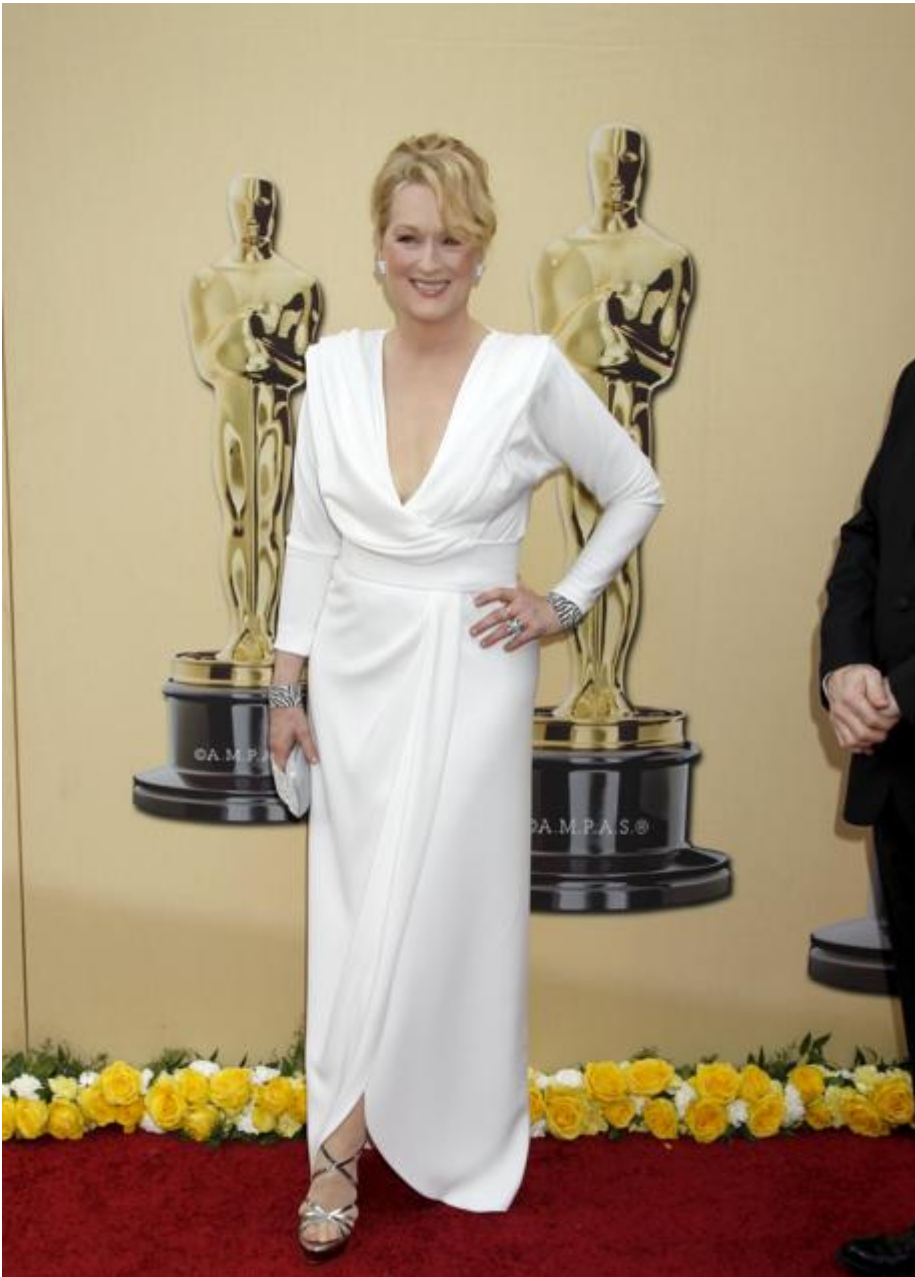
Meryl Streep en los Globos de Oro 2010