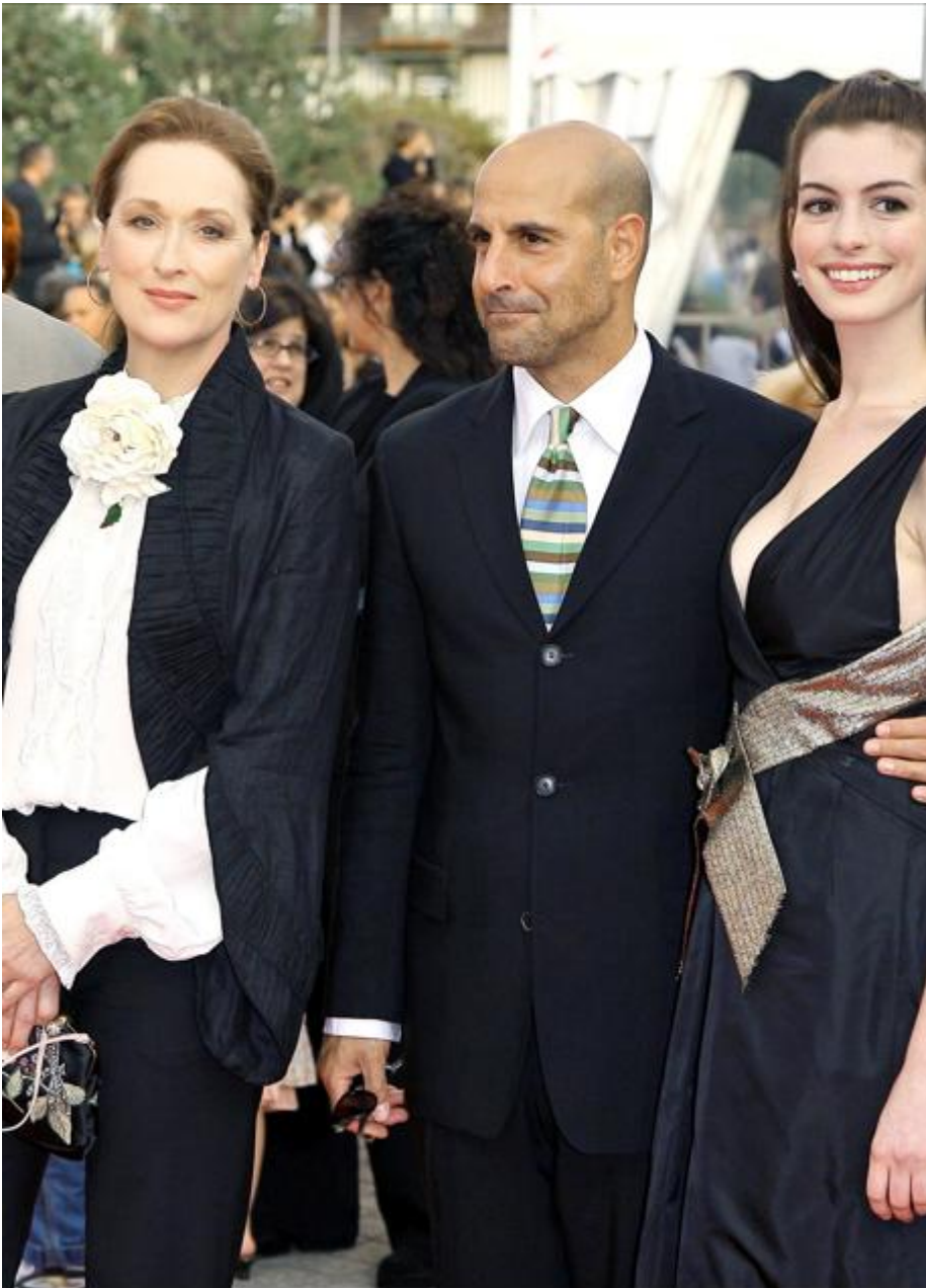
Meryl Streep en el 32º Festival de Cine Americano de Deauville