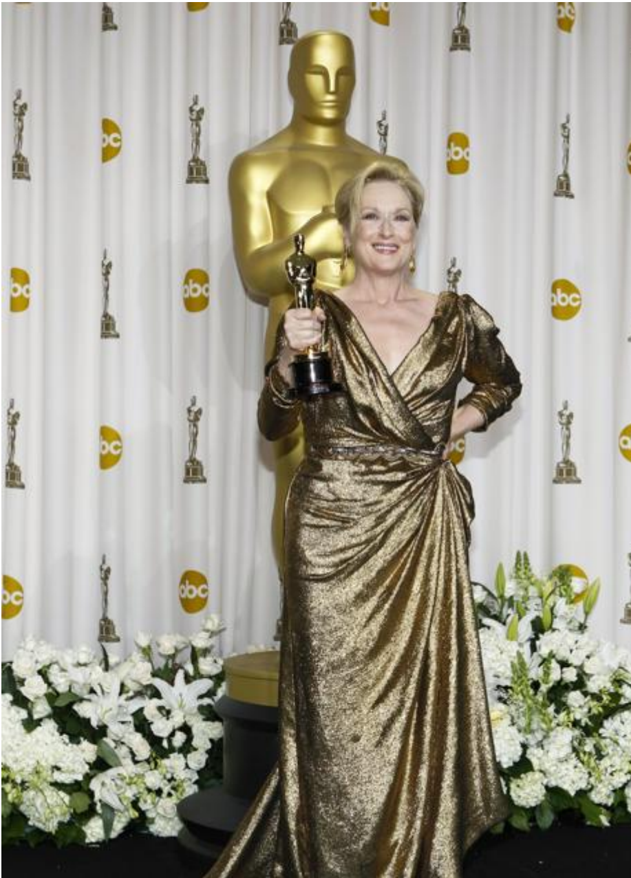
Meryl Streep en los Oscar 2012