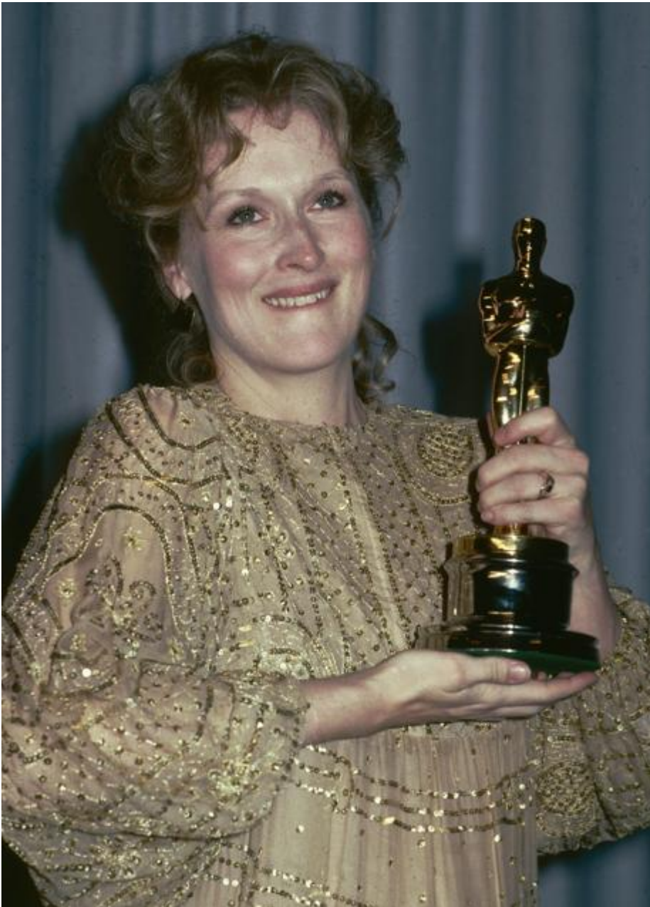
Meryl Streep en los Oscar 1983