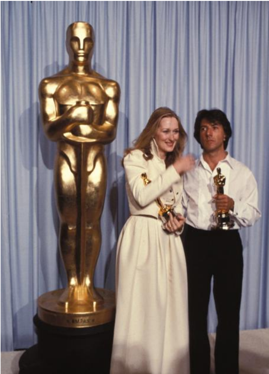
Meryl Streep en los Oscar 1980