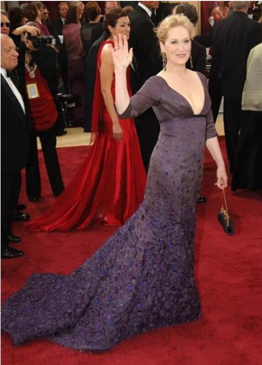
Meryl Streep en los Oscar 2006