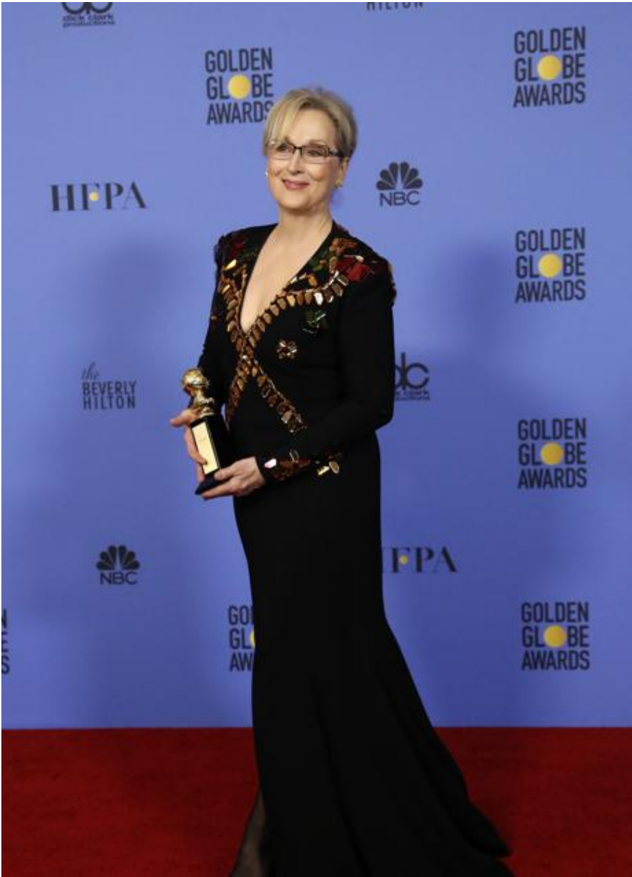
Meryl Streep en los Globos de Oro 2017