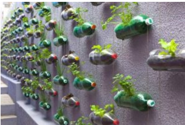
4 Servicios antiguos hechos colgadores