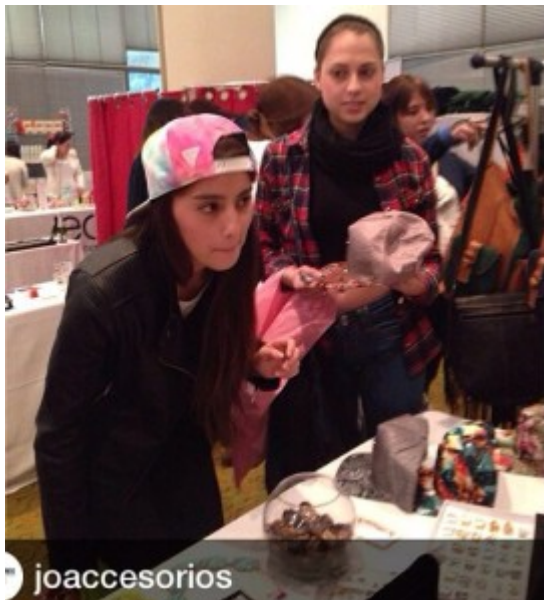
Stand de Joaccessorios en Hotel Marriot.