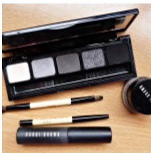
Kit para lograr el smokey eyes de la marca Bobbi Brown.

En cuanto a la sombra debes aplicar un iluminador en la zona párpado cercana al lagrimal como también en el punto más alto de las cejas. Después, usa un tono medio, ya sea gris o café, para la zona del párpado móvil. No olvides difuminar bien. Para terminar aplica el tono más oscuro en la cuenca y en el ángulo externo del ojo y vuelve a difuminar bien.