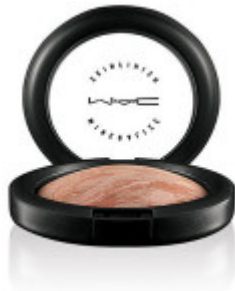
Iluminador Soft & Gentle de M.A.C 25.500 en Tiendas M.A.C

Si quieres probar esta tendencia, te dejamos una lista de iluminadores: