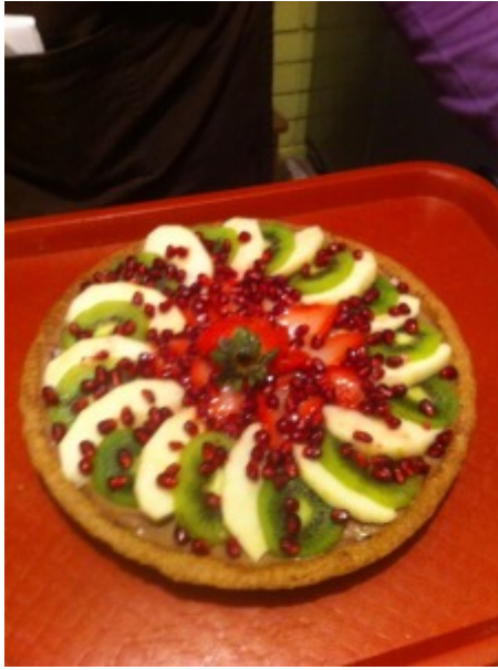
Tartaleta para diabéticos.

A partir del año 2012 La PaZtelería ha realizado distintos Talleres de Alimentación Libre de Gluten, Caseína y Soya para padres de Niños con Trastornos del Espectro Autista en las ciudades de Iquique, Antofagasta, La Serena, Santiago y Concepción; así tanto como Talleres de Alimentación Libre de Gluten para personas Celiacas; Talleres de Pastelería Saludable Baja en índice Glucémico y Libre de Azúcar para personas con Diabetes y Resistencia a la Insulina; Talleres para personas con Alergias Alimentarias Múltiples; Talleres de Cocina Saludable, Naturista & Gourmet, entre otros muchos talleres que realizan en Chile, y que prontamente comenzarán a impartir en otros lugares del Mundo.