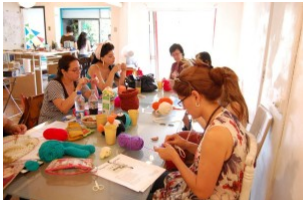
Un grupo de mujeres aprendiendo a hacer manualidades