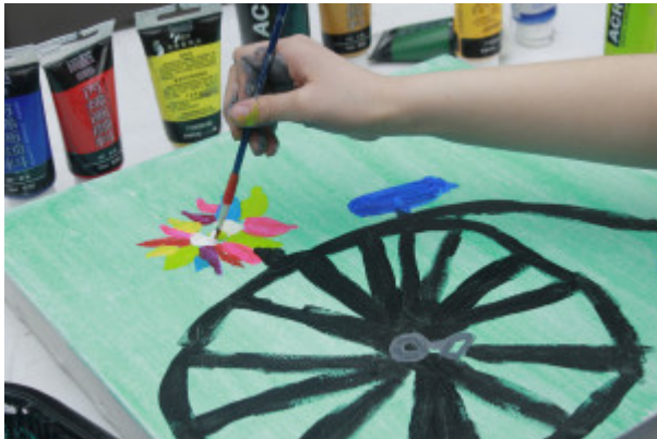
Alumna pintando un cuadro

primeros trabajos grupales que realicé en Taller Kalma, y me quedé con una sensación muy grata de poder entregar un pedacito de mí, y también ver que lo que les estaba enseñando lo hacían con tanto cariño y dedicación”, agregó la egresada de Artes.