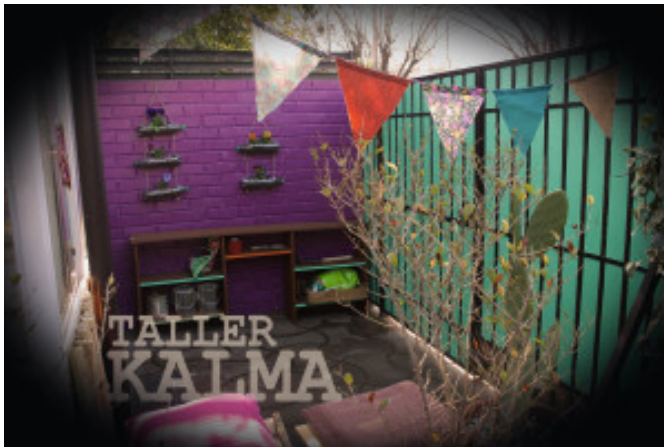
El interior de Taller Kalma