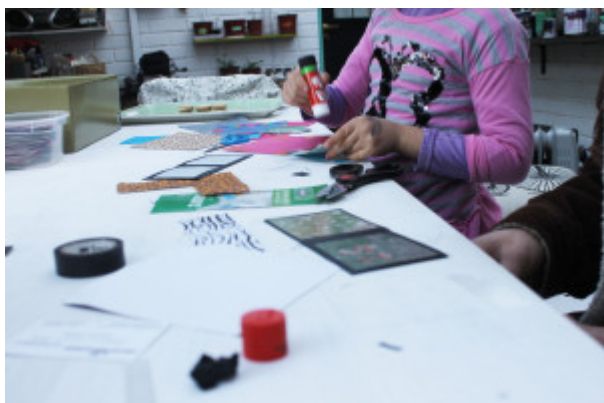
Una niña aprendiendo a realizar manualidades