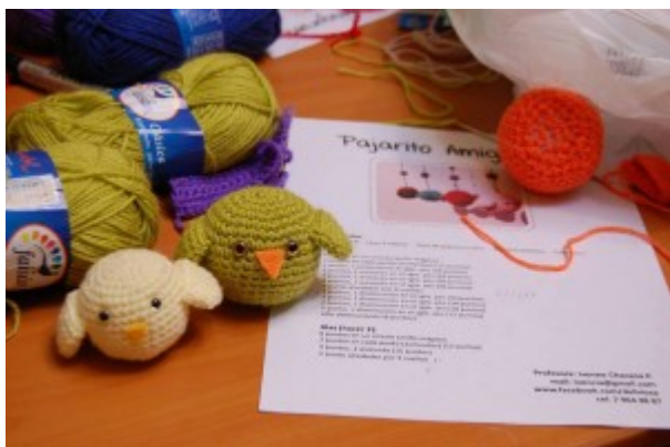
Algunos trabajos realizados en el taller

Los valores de los talleres van desde los $15.000 hasta los $43.000 (valor de mensualidad). Cada taller incluye todos los materiales necesarios para realizar las manualidades. “La gracia de estos talleres es que tejemos un proyecto en clases que al final cada alumna se lleva a su casa, y pueden ser gorros, amigurumis, granny square, chalecos, canastos, etcétera. Además la mayor parte de las veces es algo que puedes usar tú, tus hijos o decorar la casa, por lo que las alumnas se van súper satisfechas con sus trabajos”, comentó la directora del taller.