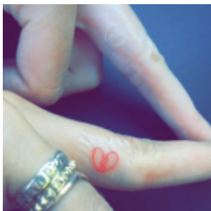
Tatuaje Kendall Jenner y Hailey Baldwin

Si no eres modelo , o incluso no te consideras una amante de los tatuajes, el atractivo de estos tatuajes que casi ni se ven, es muy claro.