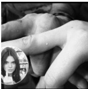
Tatuaje Kendall Jenner

Jenner recientemente se hizo dos tatuajes, ambos de tinta blanca en el dedo medio. El primero, un punto blanco, que es prácticamente el epítome del minimalismo ; el segundo, el contorno de un corazón roto con su amiga Hailey Baldwin que también es modelo. Son tatuajes que quedan bonitos y no plantean un problema a su creciente carrera como modelo.