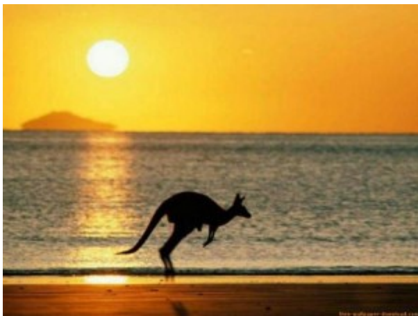
Canguro en la playa